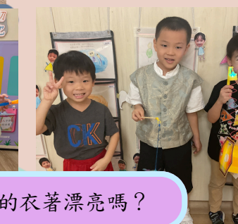
我們的衣著漂亮嗎?