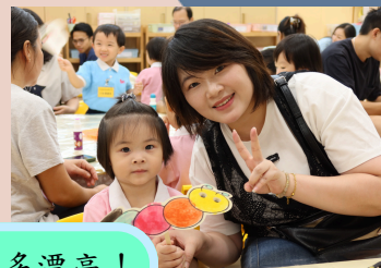
你看我的毛毛蟲多漂亮!