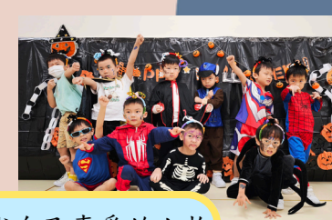
我們打扮成自己喜愛的人物