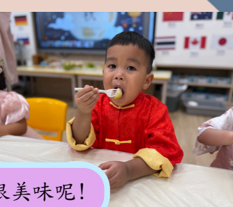
中秋節的食品很美味呢!