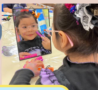
要把自己畫得美美的