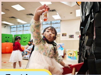
Trick Or Treat !