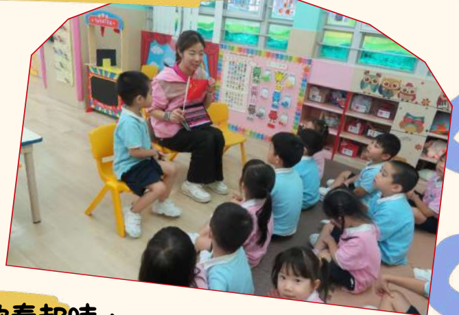
升旗儀式和學習當國歌奏起時， 幼兒表現莊嚴和尊重的態度