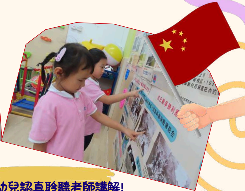
幼兒認真聆聽老師講解!