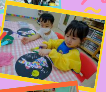
幼兒一起做中秋節圖工!