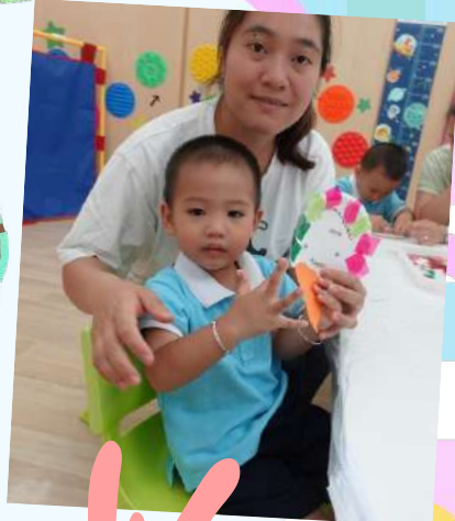
我們一起做了漂亮的雪糕!!