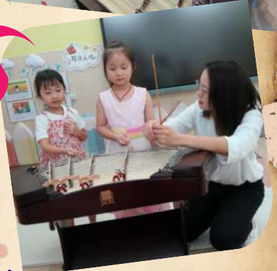
幼兒對不同的樂器都感到好奇！