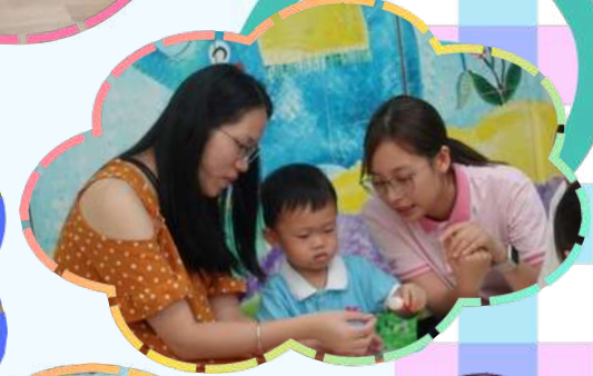
家長和小朋友正在用心做圖工!