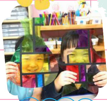
學校的活動 真多姿多彩呢!