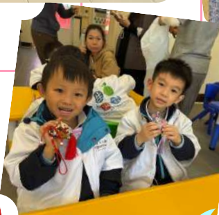
我們正在製作「驅蚊香包」呢!