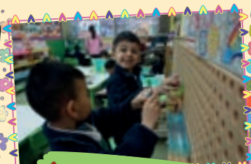
合作設計水管路線