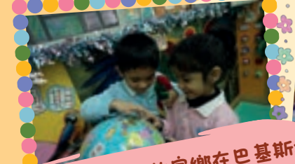
與同伴分享自己的家鄉在巴基斯坦