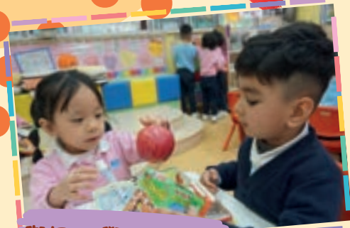
與同伴學習新詞彙