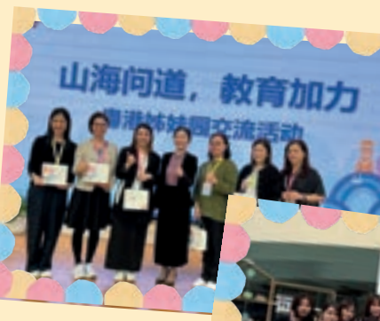
深圳市坪山區坪山中心幼兒園

為持續提升教學質素，機構於11月14日「教師發展日」安排老師到深圳參觀了兩所幼兒園，從中與當地老師互相交流教學方法和環境佈置，為日常教學提供了寶貴的參考和新思路。