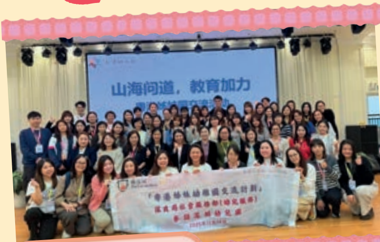
深圳市鹽田區鹽港幼兒園