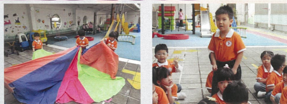
我們一起打開快樂傘，學習分工合作！