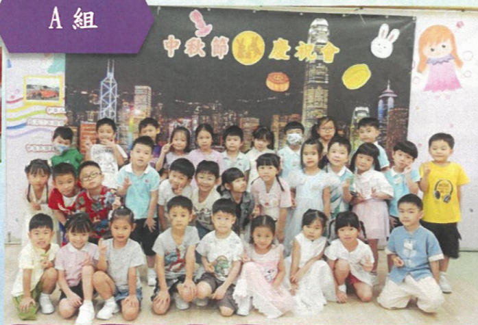
一起來張大合照，祝大家中秋節快樂！