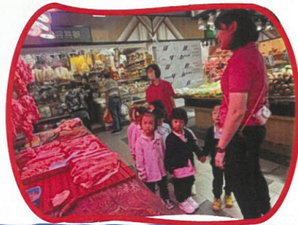
原來未煮熟的雞翼是這樣的！