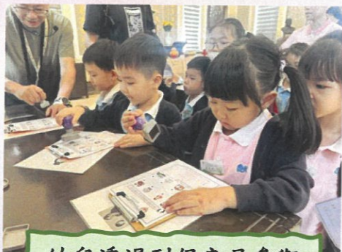
幼兒透過到保良局參觀和體驗，加深認識不同的社會文化。