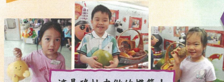
這是碌柚皮做的燈籠！