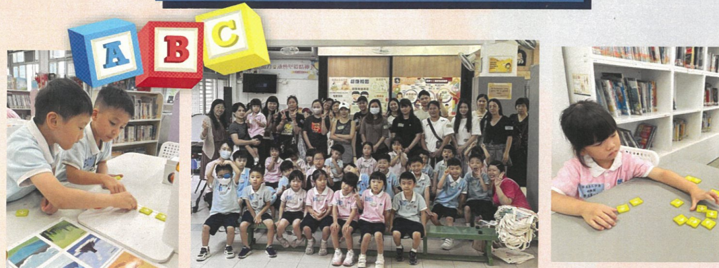
我們到小學參觀，認識小學的設施和環境。