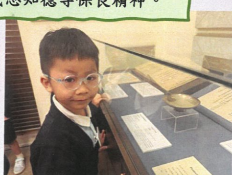
參觀博物館時要保持安靜！