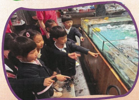
幼兒走到售賣海鮮的檔攤，對蟹特別感興趣。