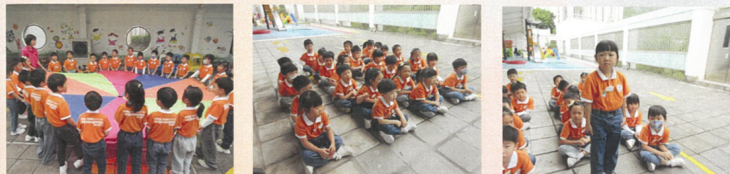
小小童軍向前進，向前進！