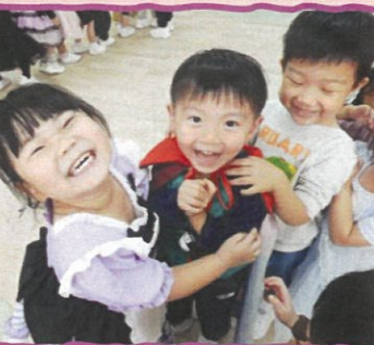
我們一起玩小火車遊戲。