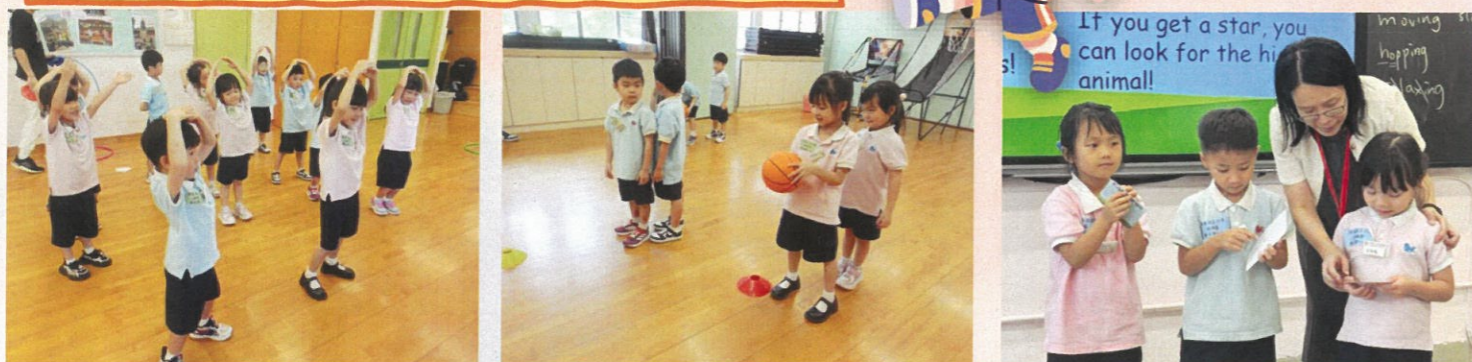
英文課很有趣，從遊戲中認識了不同動物的名稱！