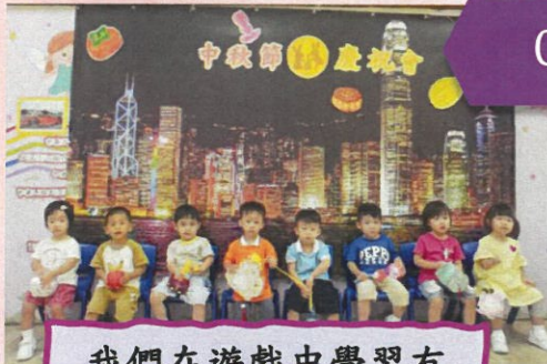
我們在遊戲中學習有關中秋節的知識。