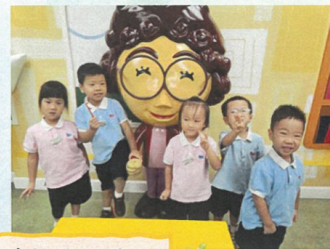
每天起床及睡前都要刷牙，保持牙齒健康！