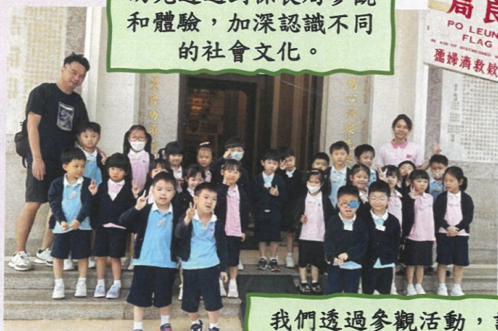
我們透過參觀活動，認識相互尊重、行善助人及感恩知德等保良精神。