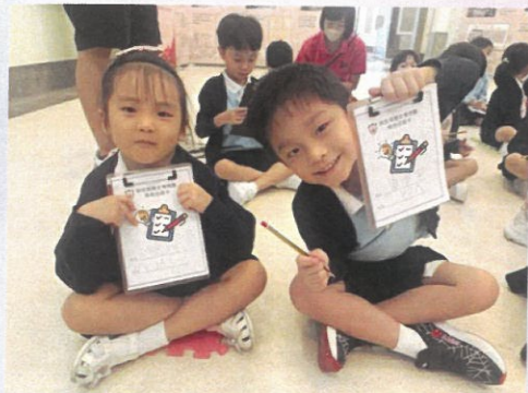
今年是保良局成立 147 週年！