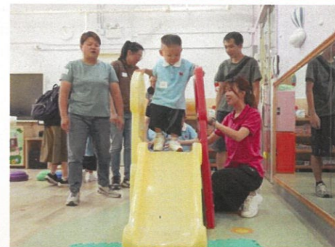
學校生活真開心，可以玩滑梯、做手工和弄小食。