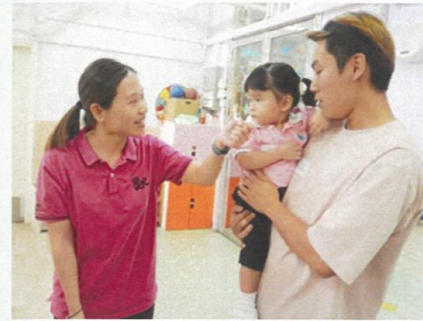
爸爸陪我一起上學。