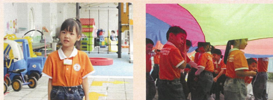
我們透過進行不同遊戲，學習「日行一善」！