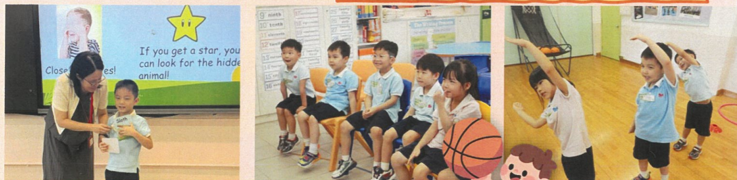
做運動前要先做熱身，大家都享受活動過程。