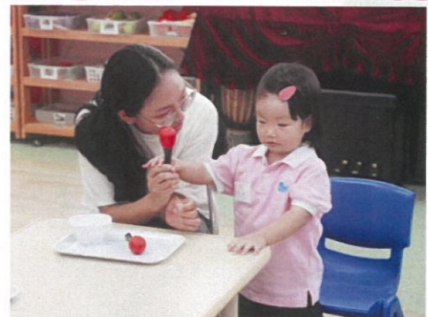
幼兒都很享受遊戲的樂趣。