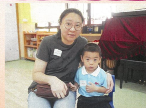
我和媽媽一起做親子食物面譜。