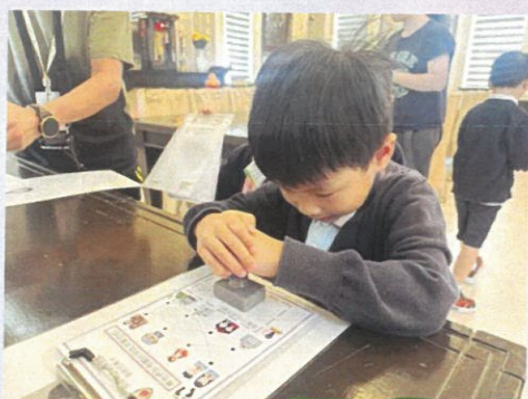
保良局秉承「保赤安良」的宗旨服務香港市民。