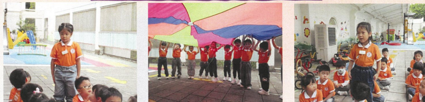
小童軍活動強調培育幼兒品德發展，建立堅毅的處事態度。