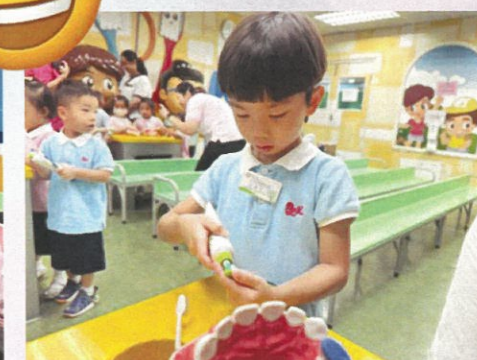
我們要保持牙齒健康，每年都要找牙科醫生檢查牙齒！