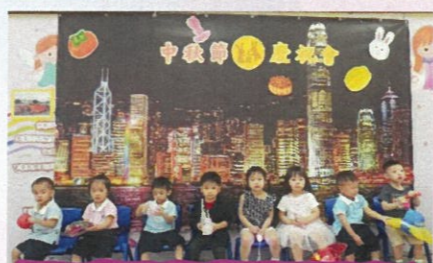
我們都準備了不同款式的燈籠。