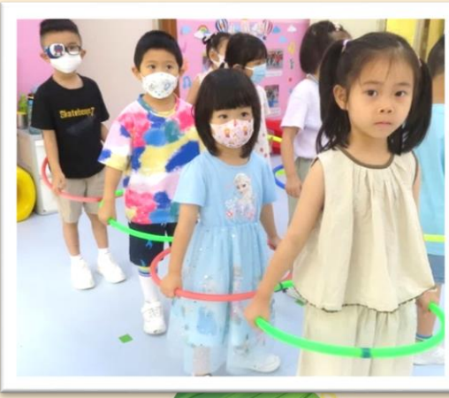
我們運了很多粽 子！很厲害呢！