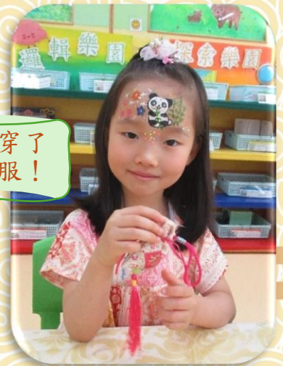
我把乾玫瑰花放 進香包裡！