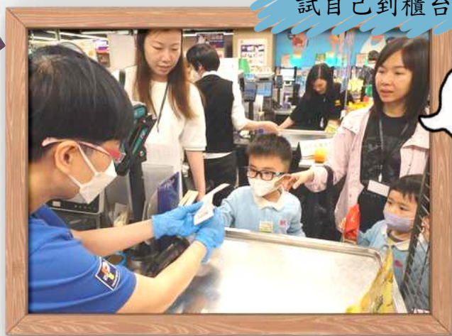
我想買這個! 謝謝姨姨!