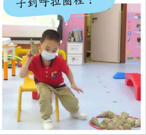
我成功拋了很多粽 子到呼拉圈裡！