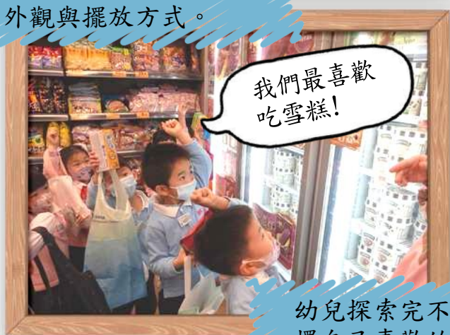
我們最喜歡吃雪糕!