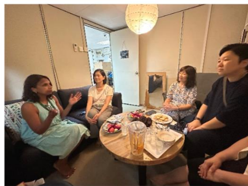
Blue House @ Kay Siang