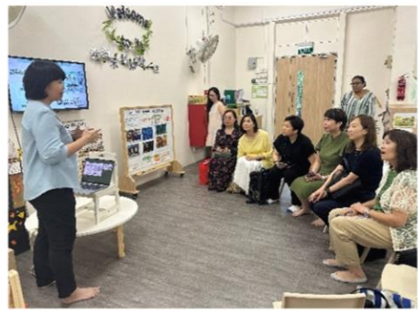
Little Olive Tree @ Yishun