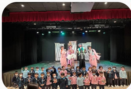
粵劇幼兒互動劇場