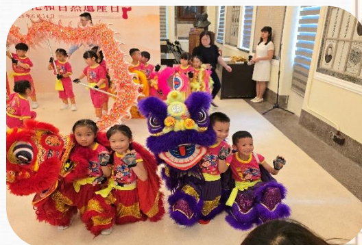
中國文化及自然遺產日