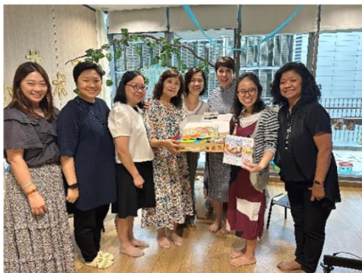
Little Skool House @ Yishun Community Hospital