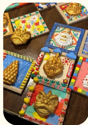
探索中華文化教師培訓 - 長洲

學校舉辦有關中華文化家長工作坊、義工活動以及中華文化體驗日，讓 家長 知悉進行相關活動的目的，深入了解中國傳統文化，同時可以與孩子一同交流。