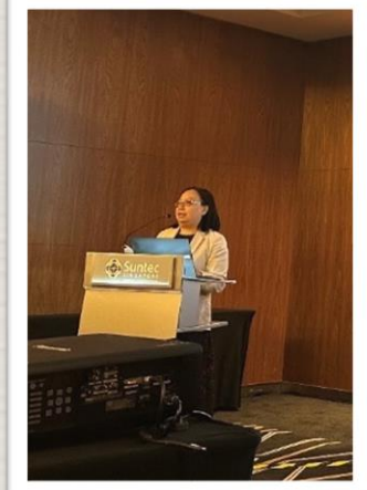
Good Start Conference 2025 @ Suntec City