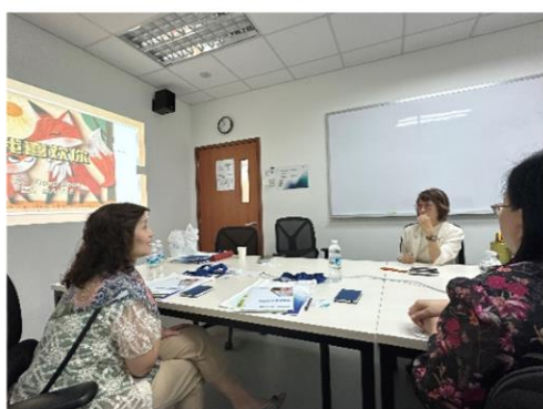
KLC International Institute