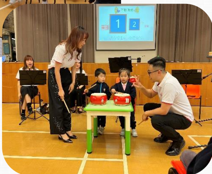
中樂推廣和互動音樂會