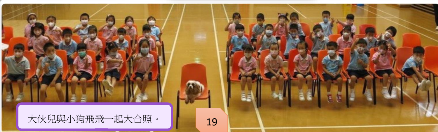
大伙兒與小狗飛飛一起大合照。