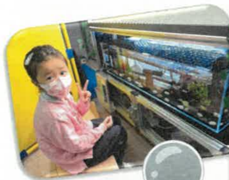
透過「魚菜共生」的生態系統，我們種植了生菜呢！