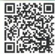
學校網頁 QR Code

歡迎大家瀏覽我們的新網頁，掃一掃 QR Code，大家便可以看到我們校園的最新資訊！