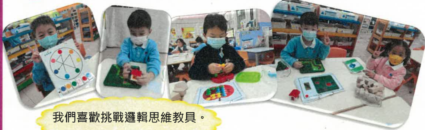
我們喜歡挑戰邏輯思維教具。