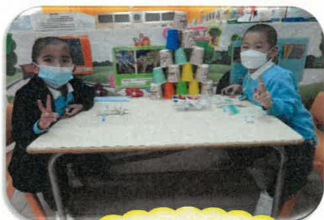
「自由探究天地」讓我們發揮無限創意。