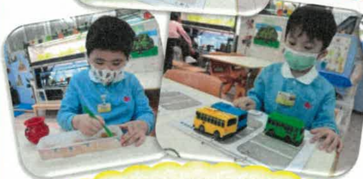
識數教具和牆上識數遊戲鞏固我們的識數概念。