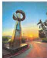
香港回歸十週年紀念雕塑