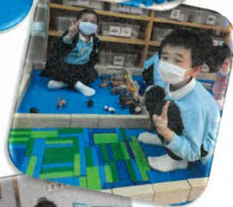
猜猜我們在「創建新天地」拼砌了哪些建築物？