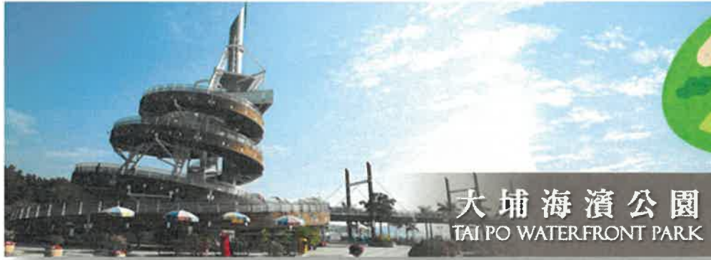
大埔海濱公園 TAI PO WATERFRONT PARK