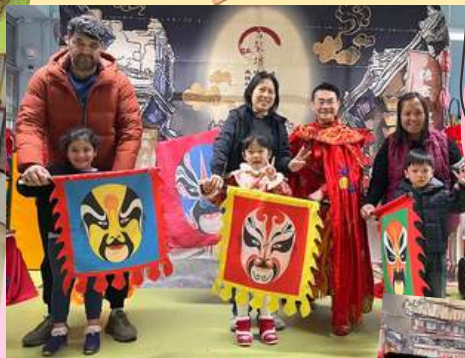
家長和小朋友都非常投入觀賞變臉及古彩戲法表演!