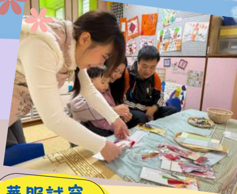
華服試穿 體驗活動