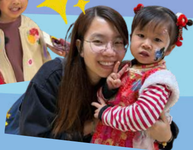
最受歡迎的面部彩繪活動