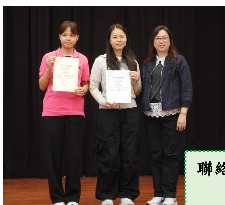
聯絡 陳家寶女士 吳錦儀老師