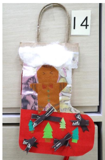
得獎者：丘朗熙 作品編號:14(共得 3 票)