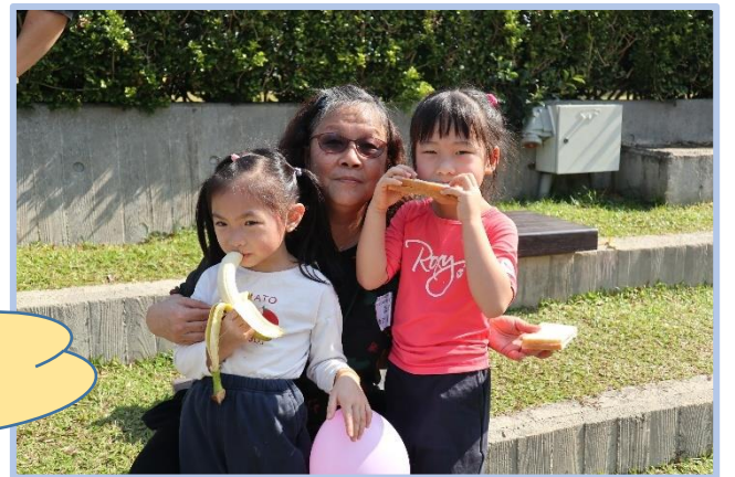
我們在玩「踩氣球」及在添馬公園野餐！