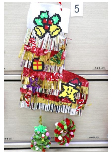
得獎者：陳柏霖 作品編號:5(共得 12 票)